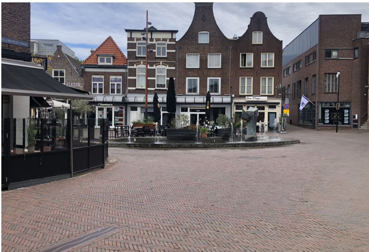
Kleibersestraat 25 29, Tiel